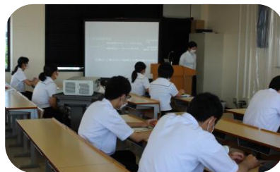
↑生徒の人数が多い授業では大きな目的ホール等を使っています。また授業の遅れを取り戻すためICT教材を使う先生も多くいます。