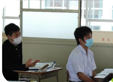
↑教室の換気も行います。