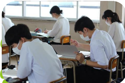
↑全員がマスクをして授業を受けています。