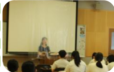
↑授業が行われる全ての部屋の黒板前に、透明のビニールを設置しています。